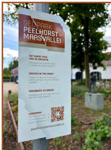
Het beeld van de IJzerbroekwerker in Sint Hubert is een van de locaties waar de nieuwe bordjes hangen.

Er valt genoeg te ontdekken, ook qua geschiedenis. Bij alle 'breukenplekken' in de gemeente zijn nu informatiebordjes geplaatst. Stap op de fiets, scan de QR-code op het bord en je weet meteen waarom die plek zo bijzonder is! Op onderstaande kaart kun je alle locaties vinden.